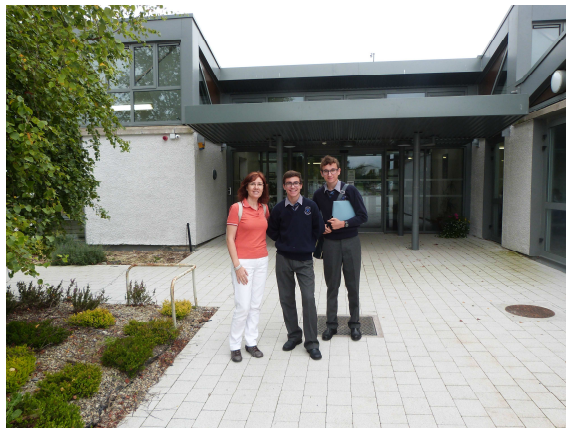
Dunshaughlin Community C.