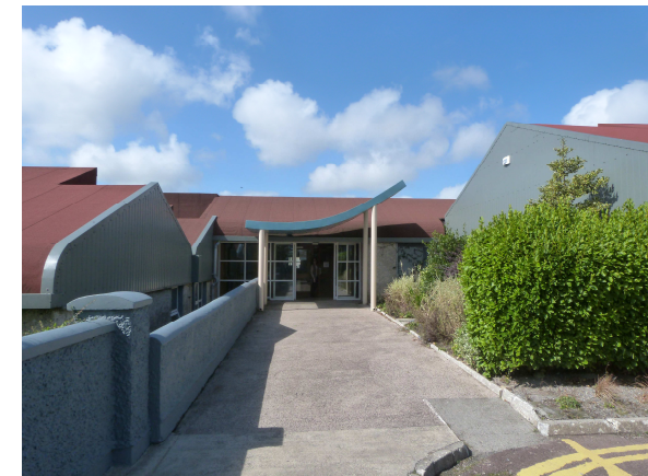
St. Paul's Community College