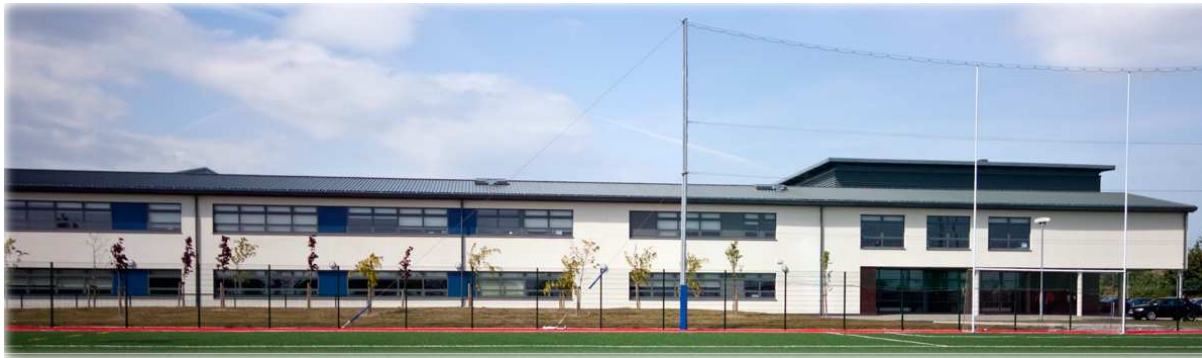
Ballinteer Community College